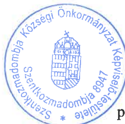
Káli Lajos polgármester Szentkozmadombja Község Önkormányzata