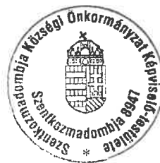
Káli Lajos polgármester